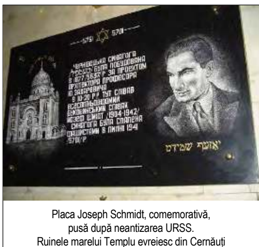
Placa Joseph Schmidt, comemorativă, pusă după neantizarea URSS. Ruinele marelui Templu evreiesc din Cernăuți

de monumentala gară, o stradă poartă numele marelui artist. Suceava a avut și un Concurs Internațional de Canto „Joseph Schmidt” (inițiator baritonul Andras Chiriliuc, aflat astăzi în Anglia). Nici un alt oraș din lume nu l-a onorat mai mult pe Joseph Schmidt decât Suceava!