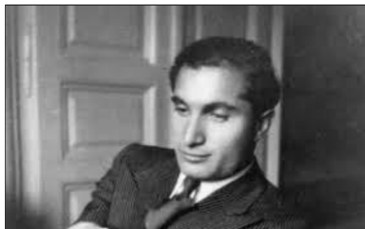
Joseph Schmidt în anul 1934, la vârsta de 30 de ani, fotografie făcută la Cernăuți

Pe mormântul din marmură neagră scrie cu litere de aur: „A căzut o stea”. O idee a mamei sale, care se referea la unul din filmele în care Joseph Schmidt a jucat rolul principal, în 1934, și care se numea „O stea cade de pe cer”. În registrul de deces al comunității evreiești din Zürich