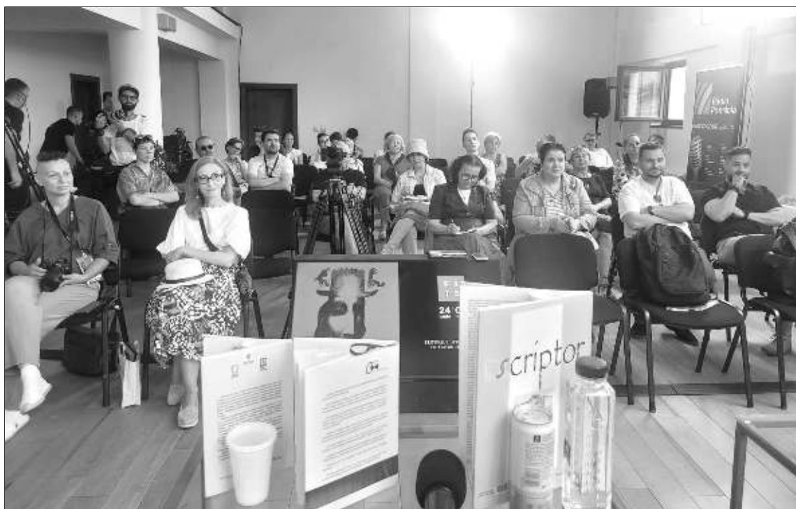
Filarmonica Sibiu. FESTIVALUL INTERNAȚIONAL AL TEATRULUI. Invitate: Editura JUNIMEA și revista SCRIPTOR, iunie 2022.